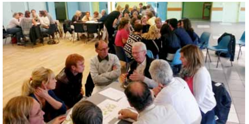
Une cinquantaine de personnes mobilisées autour du PEL.

Les différents contrats et projets de la commune arrivant à terme, la commission jeunesse s'est lancée dans l'élaboration d'un PEL. Celui-ci, piloté par la Ligue de l'Enseignement et la commune de Louvigny se construit dans la commis-