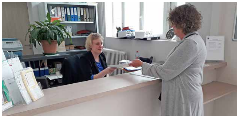
Le nouvel accueil de la Mairie

situé en haut du perron ont été supprimées. C'est maintenant une grande salle pour les mariages et les réunions municipales. Cet ensemble sera inauguré lors d'une matinée « portes ouvertes » le samedi 14 septembre prochain à laquelle les Loupiaciens seront invités.