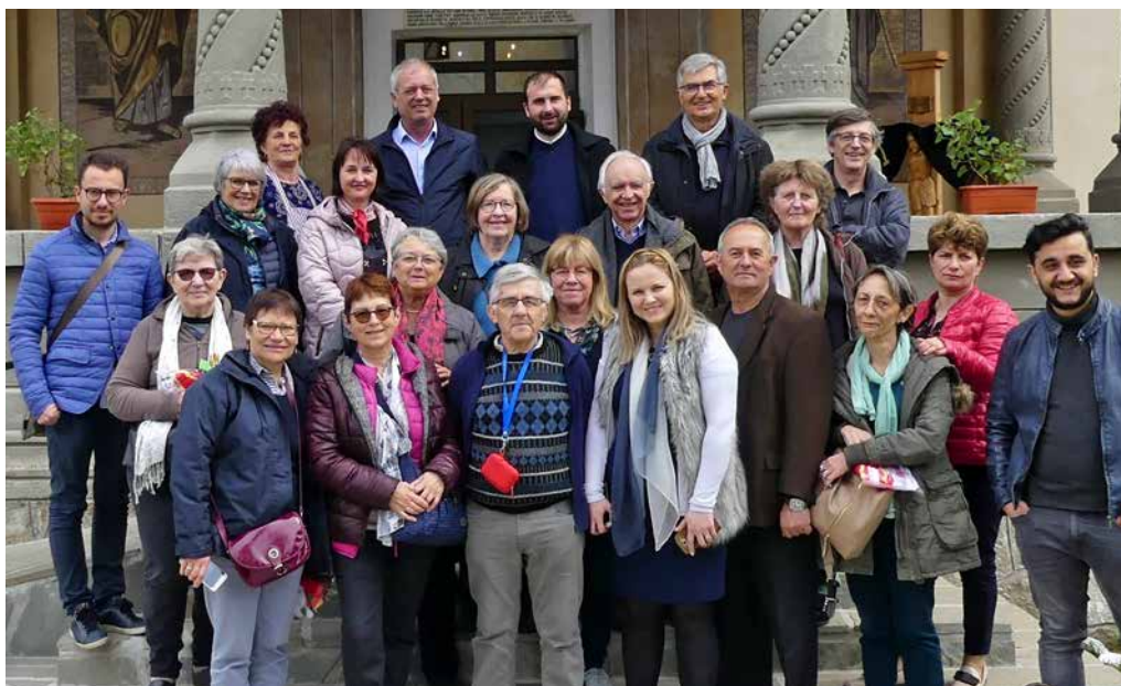
Les Loupiaciens et leurs hôtes roumains